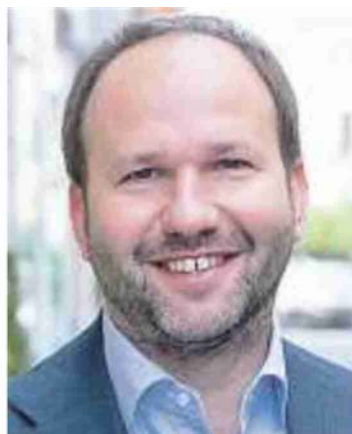
GIANPIERO ZINZI Consigliere regionale della Lega, in lizza a Caserta e a Salerno