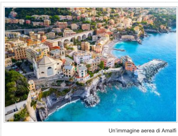
Un'immagine aerea di Amalfi

Era stato un successo lo scorso anno, come avevamo raccontato anche sulle nostre pagine , e il successo dell'iniziativa Insieme in barca a vela si è ripetuto nei giorni scorsi, sempre a cura della Cooperativa Sociale campana Autismo e ABA , in collaborazione con il Comune e la Capitaneria